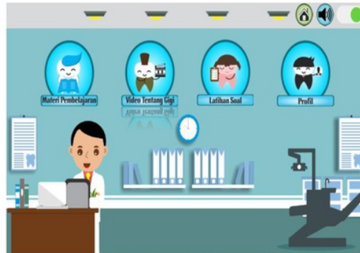
Gambar 3 Halaman Utama

Pada gambar 3 adalah Halaman Menu Utama dari aplikasi multimedia interaktif metode merawat gigi anak usia dini yang berisikan audio bendsound ukulele dan sub menu materi pembelajaran, video tentang gigi, latihan soal dan profil serta memiliki button seperti button home untuk kembali ke halaman awal dan button volume untuk mematikan atau menghidupkan suara pada halaman tersebut.