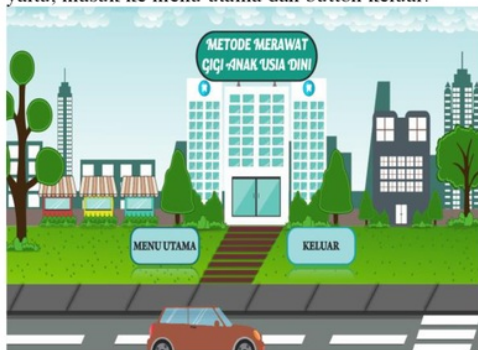
Gambar 2 Halaman Awal

Pada gambar 2 adalah Halaman Tampilan halaman awal dari aplikasi multimedia interaktif metode merawat gigi anak usia dini, halaman ini berisikan audio bendsound ukulele dan narasi serta terdapat 2 button yaitu, masuk ke menu utama dan button keluar.