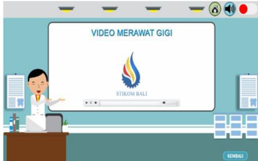
Gambar 5 Halaman Video Tentang Gigi

serta memiliki button seperti button home untuk kembali ke halaman awal, button volume untuk mematikan atau menghidupkan suara pada halaman tersebut dan button kembali untuk kembali ke halaman sebelumnya.