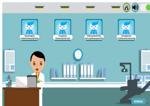
Gambar 4 Halaman Materi Pembelajaran

Pada gambar 4 adalah Halaman Menu Materi Pembelajaran dari aplikasi multimedia interaktif metode merawat gigi anak usia dini yang berisikan audio bendsound ukulele dan sub menu anatomi gigi dan tumbuh kembang gigi sulung, penyakit dan kesehatan gigi pada anak, kebiasaan buruk pada anak, pencegahan dan pemeliharaan kesehatan gigi serta memiliki button seperti button home untuk kembali ke halaman awal, button volume untuk mematikan atau menghidupkan suara pada halaman tersebut dan button kembali untuk kembali ke halaman sebelumnya.